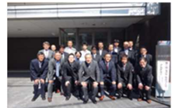
第1期受講生の皆様