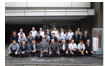
第2期受講生の皆様

本アカデミーでは、ものづくりの重要性から紐解き、生産の流れや製造工程の流れでムリ、ムダのない「ものづくりの良い設計の良い流れ」理論と手法を身に付けることができる座学、本年度から新設のIoTと設備メンテナンス管理講習等によると共に、実際に自社の製造現場において経験豊富なJPCA改善インストラクターが付く現場実習OJT研修を行う実践的なものとなっており、体感的に学ぶことができます。